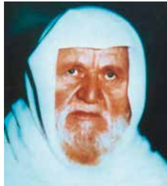
Nasir al-Din al-Albani, geb. 1914 in Albanien, gest. 1999 in Jordanien: Islamgelehrter und Verfasser zahlreicher religiöser Schriften; einflussreicher Vordenker salafistischer Lehrmeinungen.

a) Politikferne bzw. puristische Salafisten zeichnen sich durch die Unterlassung politischer Betätigung aus. Sie orientieren sich hierbei an einer Aussage des Gelehrten Nasir al-Din al-Albani, wonach die beste Politik darin bestehe, sich von der Politik abzuwenden. Vorrang haben für sie die Reinigung der Religion von unstatthaften Neuerungen sowie die Da'wa-Arbeit im Sinne der Missionierung. Darauf basierend folgt die Erziehung des Einzelnen und der Gemeinschaft im Sinne des vermeintlich „wahren“ Islam salafistischer Auffassung.