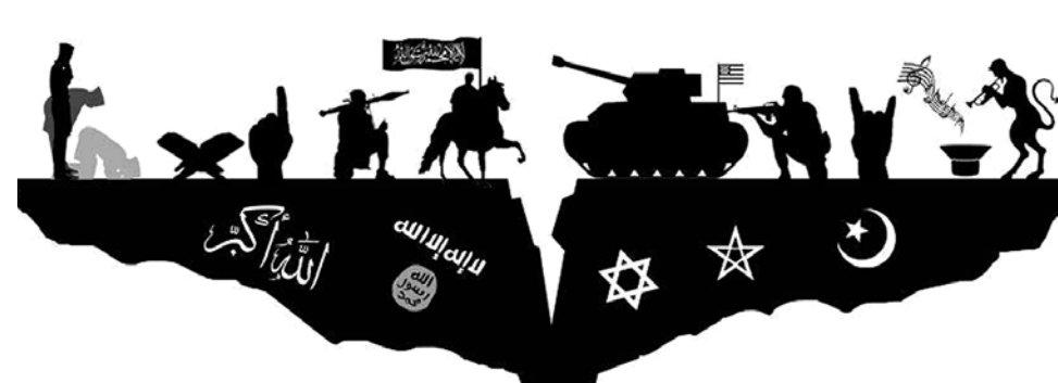
„Kampf der Kulturen“ und „Kreuzzug des Westens gegen den Islam“: Diese Botschaften werden in salafistischen Diskursen regelmäßig vermittelt.

Betrachtet man die deutsche Salafismusszene, so wird deutlich, dass es sich keineswegs um ein reines „Armutsphänomen“ handelt. Deutsche Salafisten verstehen sich als Avantgarde des Islam und verbinden reale Erfahrungen, die muslimische Jugendliche mit Diskriminierungen und Islamfeindlichkeit machen, mit diversen internationalen Konflikten wie den Kriegen im Irak und in Afghanistan oder Syrien. Auf diesen realen Erfahrungen baut die salafistische Radikalisierung auf.