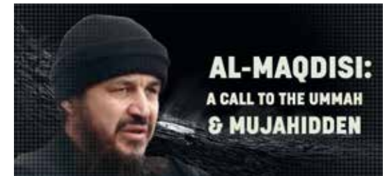
Muhammad al-Maqqisi, geb. 1959 in Nablus (Westjordanland), einer der geistigen Wegbereiter des jihadistischen Salafismus.

c) Jihadistische Salafisten propagieren und wenden Gewalt an – nicht nur zur Errichtung eines islamischen Staates, sondern auch zur (Re-)Islamisierung der Gesellschaft in ihrem Sinne und zur Beseitigung von Hindernissen auf diesem Weg.