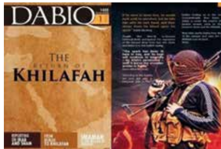
„Dabiq“, das Online-Magazin des „Islamischen Staates“ (IS), hier das Titelblatt der ersten Ausgabe vom Juli 2014 („Die Rückkehr des Kalifats“)

Ihren Kampfeinsatz betrachten Jihadisten zumeist als Verteidigung der Muslime und ihrer Rechte gegen tyrannische Herrscher oder fremde Mächte. Darüber hinaus handeln sie in der Vorstellung, einen Beitrag zur Gründung einer islamischen Ordnung zu leisten. Sofern sie sich dem „Islamischen Staat“ (IS) anschließen, sind sie gar überzeugt, an der Schaffung eines angestrebten islamischen Großreiches unabhängig von nationalstaatlichen Grenzen mitzuwirken. Ob ihr Vorgehen aber tatsächlich der islamischen Lehre und Praxis früherer Generationen von Muslimen entspricht, wird von ihnen nicht wirklich reflektiert.