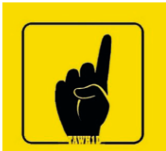
Sogenannter Tauhid-Finger: typische Geste bei Salafisten zur Betonung des Glaubens an einen einzigen Gott (tauhid).

Das islamische Bekenntnis zu einem einzigen Gott (tauhid) ist für Salafisten nicht ausschließlich ein religiöses Bekenntnis, sondern eine Aufforderung zu einer bestimmten Lebenshaltung. Demnach bedingt der Ein-Gott-Glaube eine konsequente Verinnerlichung, Verwirklichung und Aufrechterhaltung dieses Bekenntnisses in allen rituellen und alltäglichen Handlungen. Anbetung ist im Salafismus nicht nur als gottesdienstliche Handlung zu verstehen, sondern als Ausführung der im Koran dargelegten Gesetze und Bestimmungen Gottes.