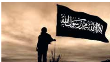
Schwarzes Banner mit dem islamischen Glaubensbekenntnis (sog. raya); historisch betrachtet oft in kriegerischem Kontext verwendet und heute von Jihadisten.

Diese Auswahl von Beispielen belegt, welche verheerende Wirkung salafistische Propaganda in Deutschland ausüben kann und zeigt deutlich, dass eine zunehmende Zahl von Anhängern militant agiert. Die Ursache liegt in der stärker werdenden gewaltverherrlichenden und volksverhetzenden Propaganda einiger salafistischer Pre-