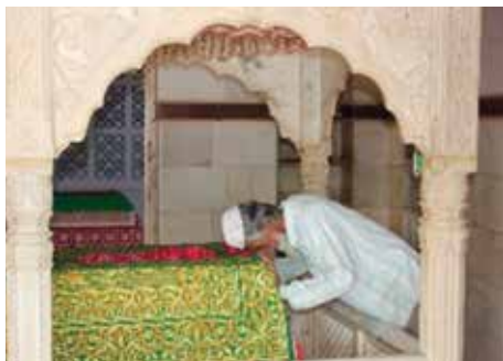
Für Salafisten eine unerlaubte religiöse Neuerung (bid'a): die Verehrung von Heiligen und der Besuch ihrer Gräber.

Der arabische Begriff Salaf bedeutet Vorfahren. Für Salafisten umfassen diese Vorfahren den Verkünder Muhammad (gest. 632), seine Gefährten sowie die beiden darauffolgenden Generationen von Muslimen. Nach salafistischer Auffassung markiert das Jahr 855, das Sterbejahr des sunnitischen Rechtsgelehrten Ahmad Ibn Hanbal, das Ende der „gesegneten Salaf-Epoche“. Die Salaf-Epoche wird in den salafistischen Diskursen als die „goldene Ära“ der muslimischen Gemeinschaft dargestellt, in der ein islamisches Weltreich begründet wurde. In den nachfolgenden Generationen sei der „wahre“ Islam Entstehungsprozessen ausgesetzt gewesen, die bis in die Gegenwart fortwirken. Dies habe zum tendenziellen Niedergang des Islam und der politischen Ohnmacht der Muslime weltweit geführt. Um die Reinheit und Wahrhaftigkeit des Islam wiederherstellen zu können, sei es unumgänglich, die religiöse Praxis, die Lebensführung sowie Staats- und Rechtsordnung an Koran und Sunna (überlieferte Taten und Aussprüche Muhammads) – so wie sie früher von den rechtschaffenen Altvorderen verstanden wurden – auszurichten.